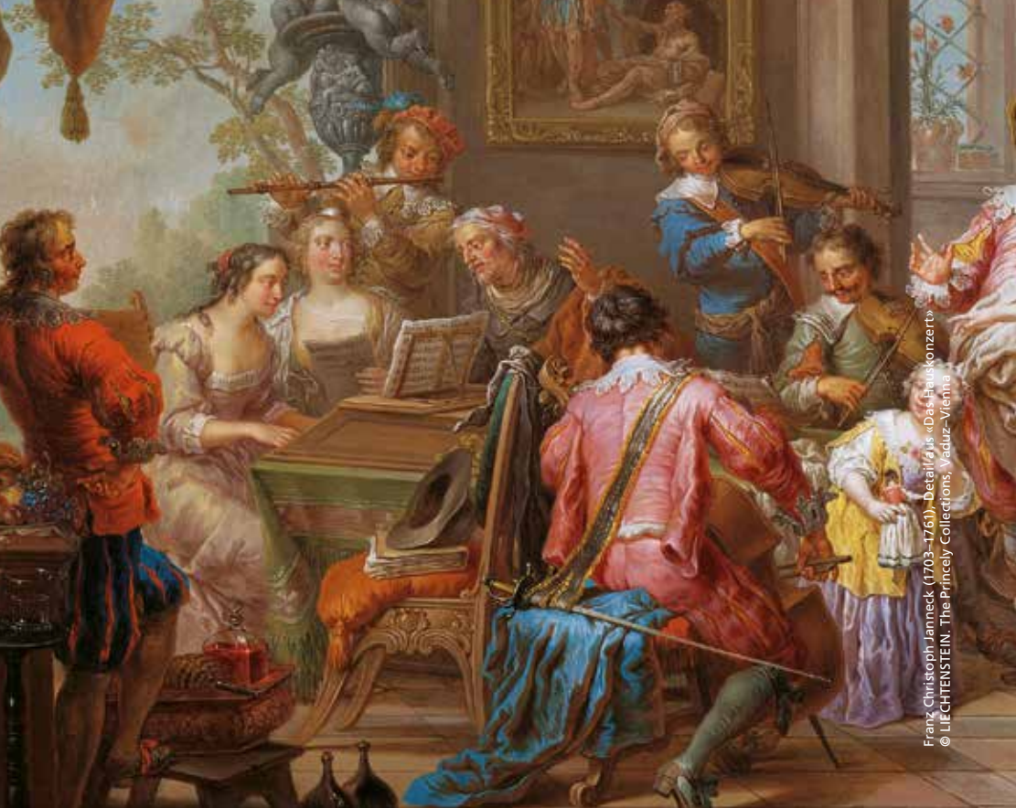
Franz Christoph Jannneck (1703–1761), Detail aus «Das Hanskonzert»