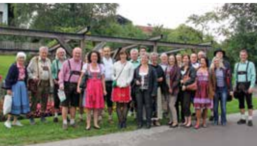
Chorausflug mit den Frauen nach Oberstaufen zum Lederhosen-Shopping, im September 2013.

In der Zeit um die erneute Namensänderung im Jahre 1990 herum war der Männerchor Schaan musikalisch und bezüglich Mitgliederanzahl auf einem Tiefpunkt angelangt. Es konnte dann ein ambitionierter Dirigent gefunden werden, der neue Wege bestritt, indem er moderne und englischsprachige Literatur aus den Bereichen Rock und Country mit dem Chor einstudierte. Dies führte zu einem beispiellosen Aufstieg des Chors. Von einer Hand voll Mitglieder wuchs der Chor auf über 40 Sänger mit vielen jungen Leuten an. Es konnten nie erreichte musikalische Erfolge mit grossen Konzerten gefeiert werden. Auf dem Höhepunkt des Erfolgs wurden diesem Dirigenten die Urheberrechte an den von ihm arrangierten Chorsätzen strittig gemacht, woraus ein Streit entbrannte, der diesem Dirigenten einen unschönen Abgang anstelle des verdienten Danks und Anerkennung bescherten.