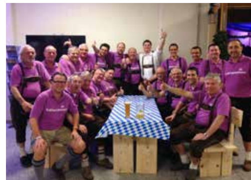
Gastauftritt der Schlagerprinzen an der Wiesngaudi von Dr. Schlager und die Kuschelebären, Oktober 2014.

Danach ging es mit dem Chor wieder sukzessive abwärts. Der damalige Vorstand des Chors machte in den Jahren 2008 und 2009 einen letzten Rettungsversuch mit einem Gospelkonzert als gemischter Projekt-Chor, welches musikalisch ein grosser Erfolg war. Jedoch verweigerten ein paar Sänger die Unterstützung dieses Projekts und nach Abschluss dessen blieb bloss noch eine Hand voll Sänger und ein Streit im damaligen Vorstand. Die Aussichtslosigkeit auf die Weiterführung des Chors wegen Mitgliederschwund und Orientierungslosigkeit führten dazu, dass im Herbst 2010 dem dama-