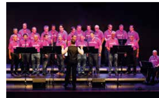
Konzert der Schlagerprinzen, Mai 2015.

Der neu aufgestellte Männerchor Schaan, welcher mit dem Bühnennamen «die Schlagerprinzen» seine Erfolge feiert, erfreut sich wieder grosser Beliebtheit. Die Umschreibung der Neuausrichtung des Chors geht aus dem Leitbild (siehe Webseite: www.mannerchor-schaan.li ) hervor.