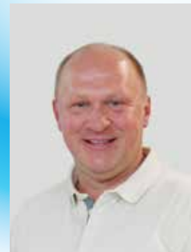
Lampert Hubert, OK-Vorsitz und Fest- präsidenschaft, Gesamt- konzeption Festschriften und Beiträge, Technik